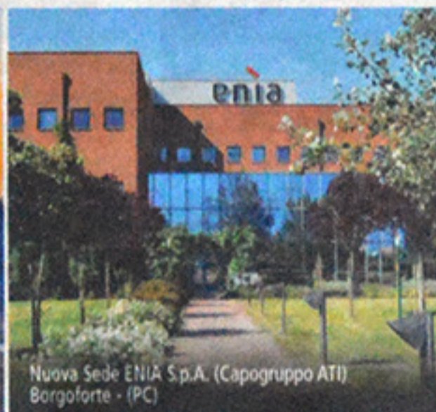
Nuova Sede ENIA S.p.A. (Capogruppo ATI) Borgoforte - (PC)