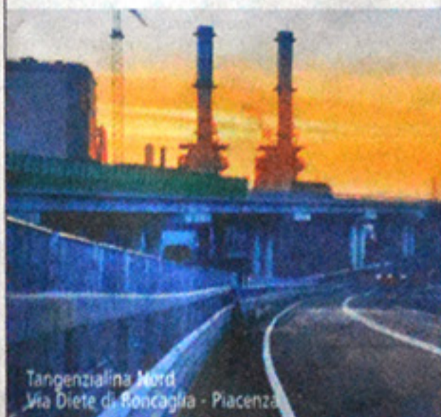
Tangenzialina Nord Via Diote di Boncaglia - Piacenza

A chi vi ha lavorato in passato il ringraziamento di chi vi lavora oggi.