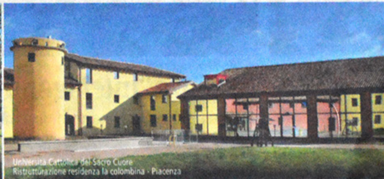
Università Cattolica del Sacro Cuore Ristrutturazione residenza la colombina - Piacenza